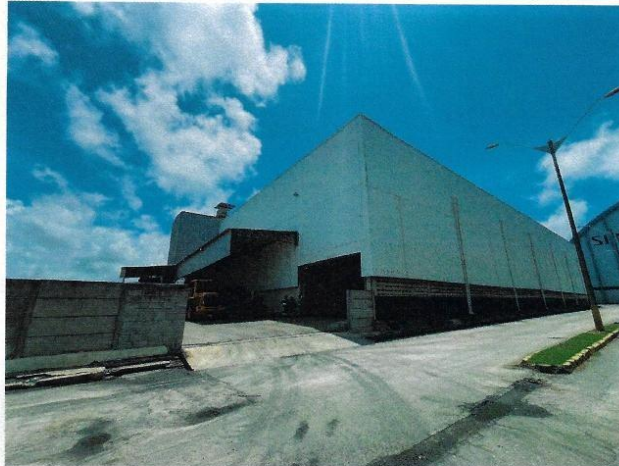
Figura 5 - Fachada Leste PDZ 04