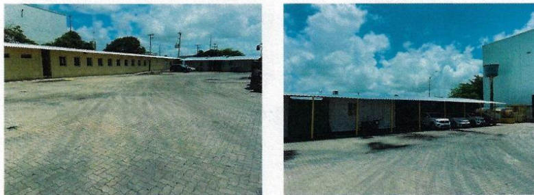
Figura 7 - Área apoio administrativo

Porto do Recife S.A. | 04.417.870/0001-11 Praça da Comunidade Luso Brasileira, 70, Recife - PE 50030280 | (81) 3183-1900