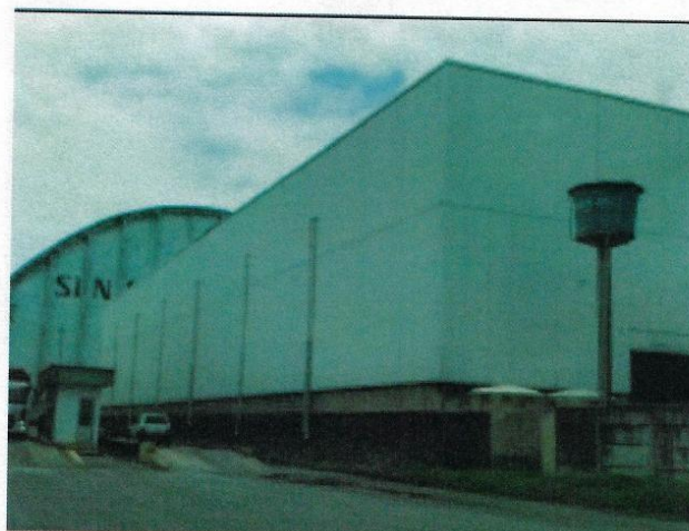
Figura 4 - Fachada Oeste PDZ 04

Porto do Recife S.A. | 04.417.870/0001-11 Praça da Comunidade Luso Brasileira, 70, Recife - PE 50030280 | (81) 3183-1900