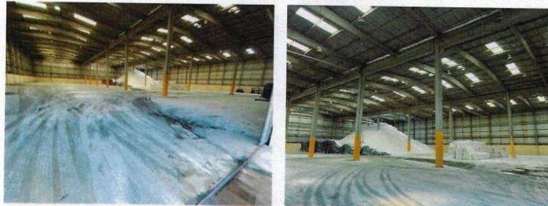
Figura 10 - Armazém 1A

Felipe Velloso de Mendonça Felipe Velloso de Mendonça