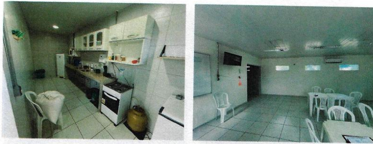
Figura 9 - Copa e refeitório