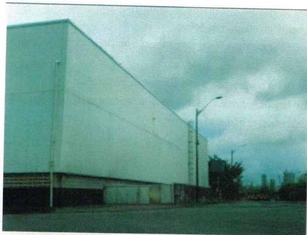
Figura 3 - Fachada Norte PDZ 04