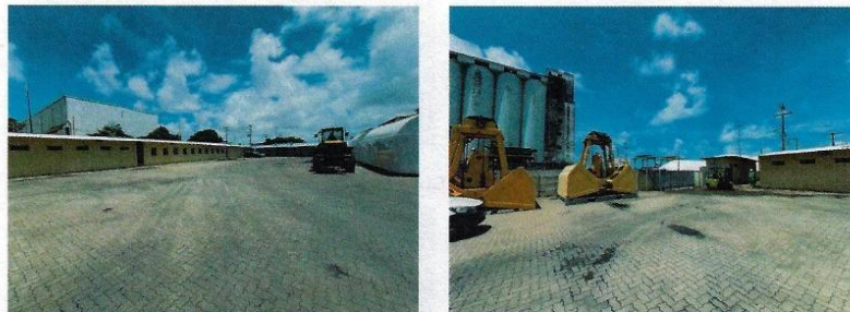
Figura 6 - Pátio PDZ 04