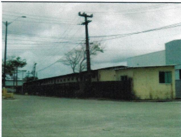
Figura 2 - Fachada Sul PDZ 04