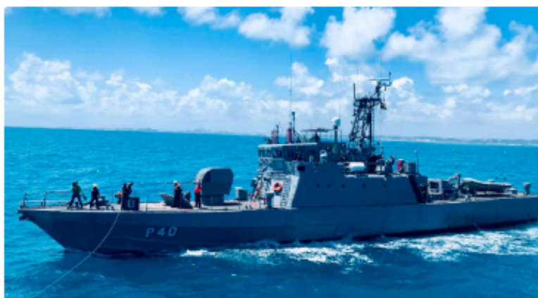
Navio-patrolha Grajaú, da Marinha do Brasil

No próximo fim de semana, o navio-patrolha "Grajaú", da Marinha do Brasil, estará aberto à visitação pública gratuita no Porto do Recife, onde atracará. A visita poderá ser feita tanto no sábado (10) quanto no domingo (11), das 9h às 15h.